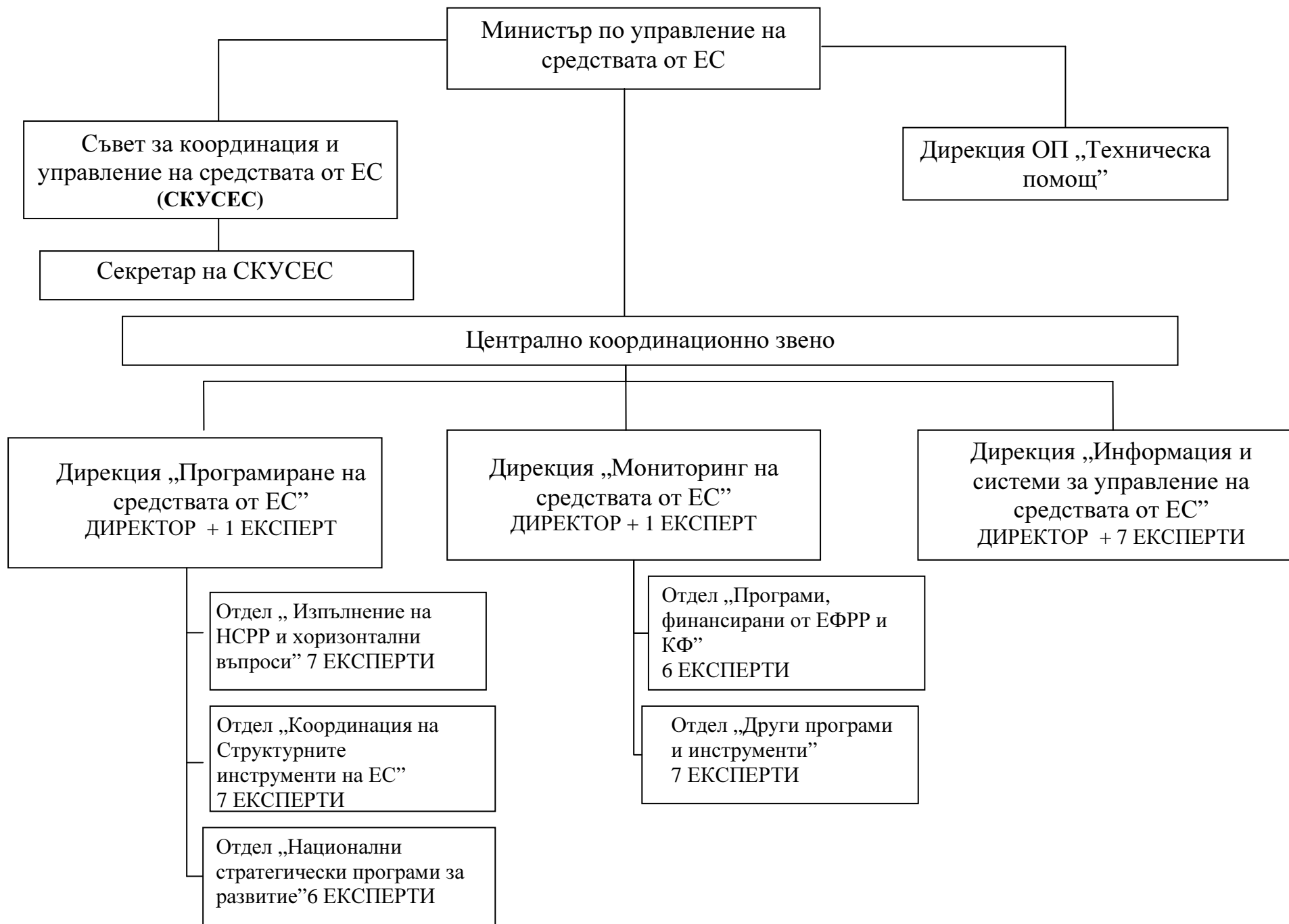
Схема № 1 Органиграма на изградената структура за координация в МС